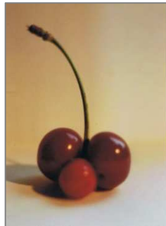
Text und Foto: Norbert Körner