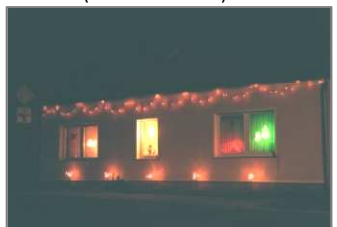
3. Platz (Fam. V. Romanus)